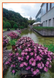
「サカタのタネ賞」 「花とグリータワー」中里 眞美子⑥