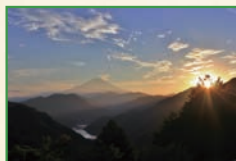
「富士フィルム賞」 〔西丹沢から望む富士と丹沢湖〕斎藤 敏雄〔山北・東御峠林道〕