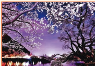
「津久井湖の夜桜」星野 郁男 津久井湖城山公園