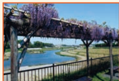
「アイスコ賞」 「藤棚より鶯舞橋の眺め」薄井 正美⑫