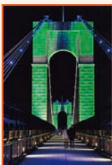
「お伽の国へ」 門倉 静男⑬