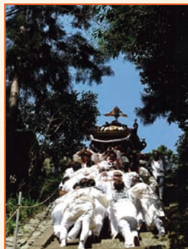
「宮出し」高橋 正仁 相模湖 与瀬神社