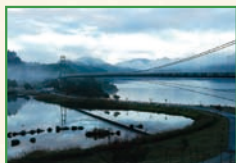
「朝もやの宮ヶ瀬湖」伊藤 良一①