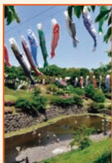
「鯉のぼりの谷」 相原 宏之⑬