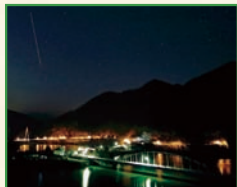
「流星湖」 飯島 恵美子③