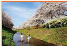
「ジャパンビレッジ賞」 「水ぬるむ頃」石井 清一⑦