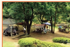
「七沢観光協会・デジサーフ賞」 「楽しくおいしい昼食の刻」山口 仁隆⑬